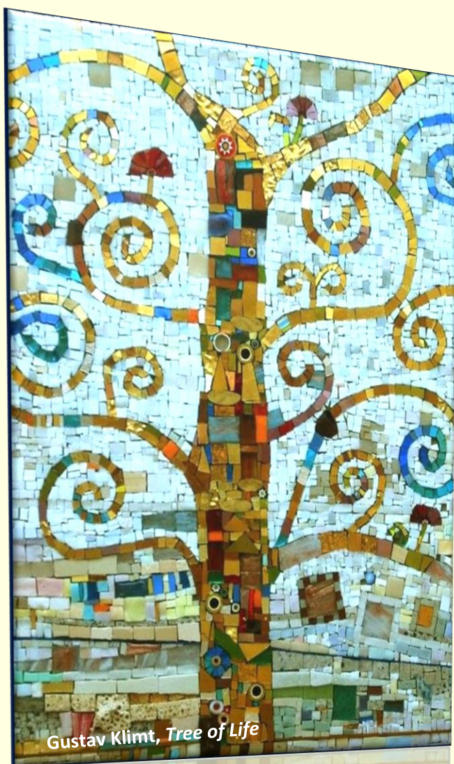
Gustav Klimt, Tree of Life

Una Scuola di qualità per un cittadino competente